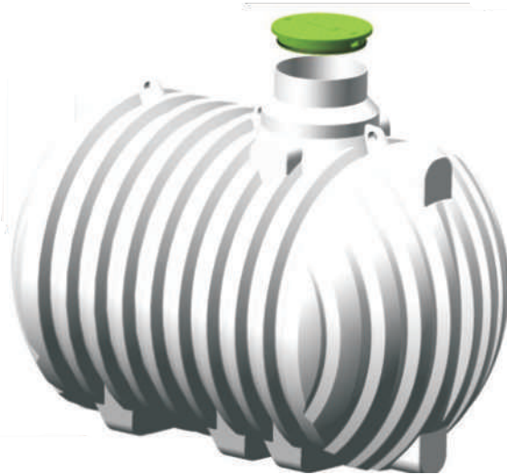
za pitno vodo