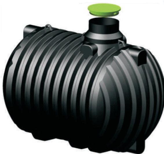
za odpadne vode